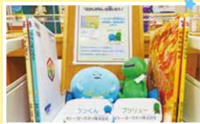
※画像は昨年度のものです。