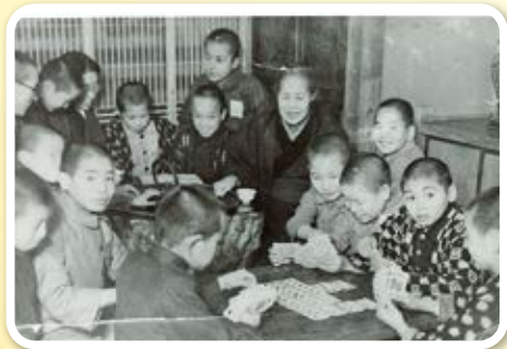
あそび トランプ遊び