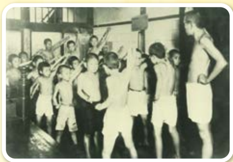
かん ま びつ 乾布摩擦