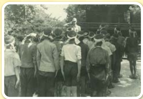
ちよう れい 朝 礼