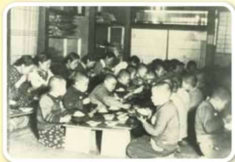
しょく じ 食 事