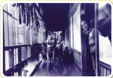
そう じ お掃除