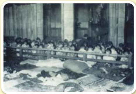
ね まえ いの 寝る前のお祈り