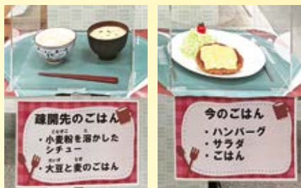
疎開先のごはんと今のごはん

そのため、食べ物が足りなくて、こどもたち はいつもおなかをすかせていました。少しでも おなかを満たすよう、こどもたちは、木の実を はじめ、バッタやカエルをつかまえて食料にした り、家から持ってきた、お手玉の中身の大豆やおなかの薬も食べていました。