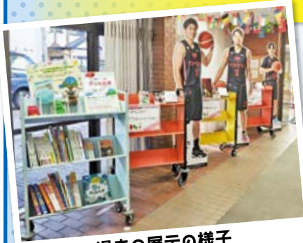
過去の展示の様子