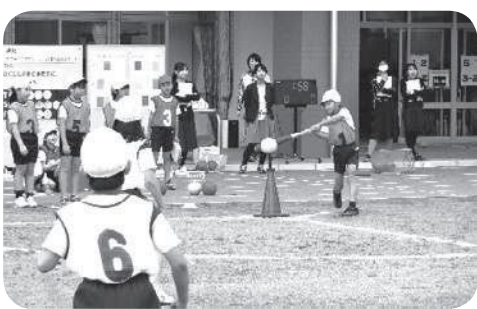
ティーパーでゲーム 「ナイス! バッティング」

ベースボール型ゲーム「ティーパー」の実践では、打つ楽しさをどの子にも味わわせることを中心に授業を作りました。ティーパーに置いたボールを打つという教材にすることで運動が苦手な子や野球経験がない子にも「やってみよう」「自分にもできそうだ」と取り組みやすくなりました。打った後、バットをコートに入れたら1点、一つのベースを踏んだら1点とすることで「できた」という実感をもつことができました。打つ楽しさを味わうと、「ボールを遠くに飛ばそう!」「ねらった所に打つぞ!」と、課題が発展していききました。また、守備の意識も高まり、守り方を考えたり、キャッチボールの練習をしたり主体的・協働的に学習を深めていく姿がたくさんでできました。