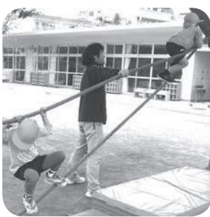
「ロープ渡りに挑戦！」 園庭のけやきの樹を活用して

南陽幼稚園では、広い園庭を活用して、こどもたちが伸び伸びと体を動かしながら、心も体も豊かに育む教育の推進に取り組んでいます。